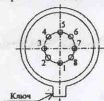
Схема расположения выводов

Сертификация проведена на соответствие требованиям ГОСТ РВ 20.57.412-97, ГОСТ Р ИСО 9001-96