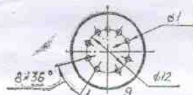
Схема расположения выводов

Миниатюрный двойной триод с раздельными катодами косвенного накала типа 6Н23П предназначен для использования в радиотехнических устройствах в качестве широкополосного усилителя высокой частоты с низким уровнем шумов, а также в схемах маломощных усилителей и генераторов импульсов.