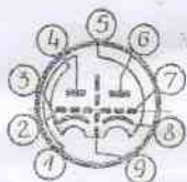
Схема соединения электродов с выводами